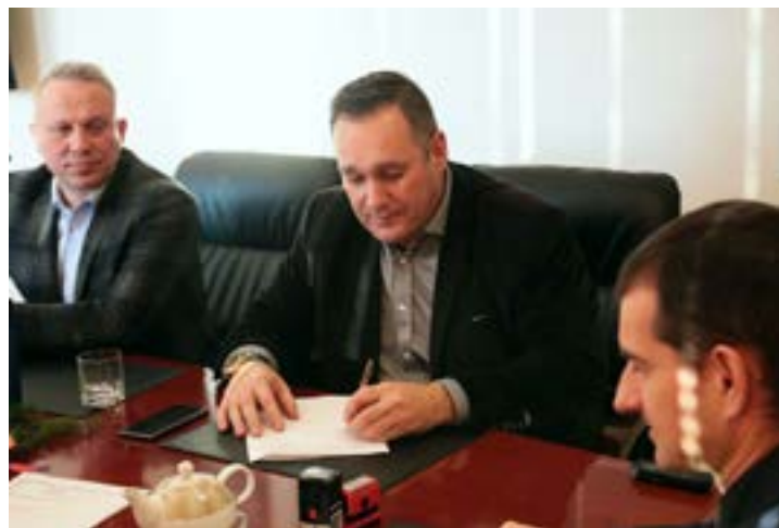
Piotr Rećko, Starosta Sokólski, podczas podpisywania umowy dotyczącej przebudowy drogi nr 1281B

Zgodnie z przewidywaniami prace mają się zakończyć jeszcze w tym roku, w grudniu.